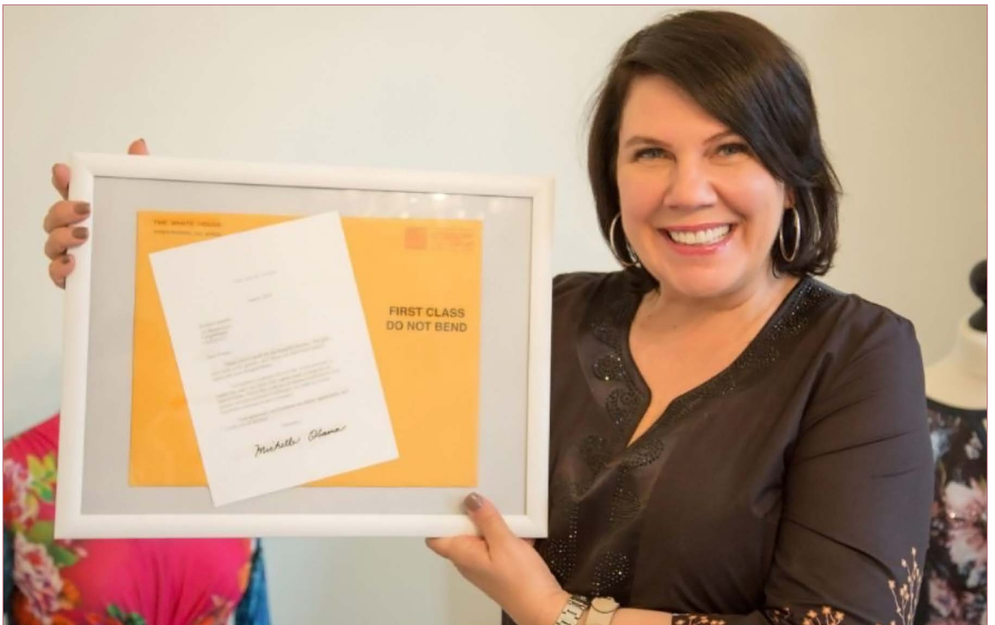
veröffentlicht am 21.11.2016 - 15:54 Uhr